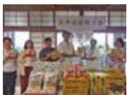
北中城村 商工会青年部