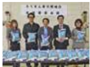
ろうきん 普天間地区 推進委員会