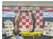
イオンライカム店・ イエローシート