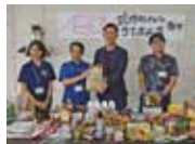
イオン琉球(株) イオンライカム店