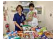
EMウェルネス暮らしの 発酵ライフスタイルゾート