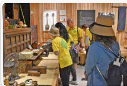
名護市博物館を見学