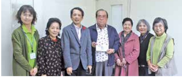
北中城村老人クラブ連合会