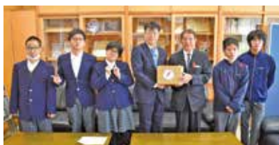
はなさき支援学校