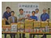
北中城村 商工会商業部会