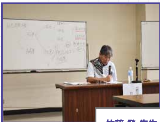
成年後見制度と日常生活自立支援事業の概要

中級クラスを修了された1名が2月1日付で生活支援員としての登録を済ませ、活動に向けて先輩生活支援員さんと支援に同行しています。