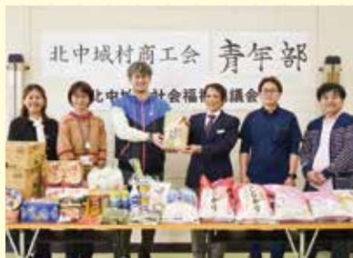
北中城村商工会青年部