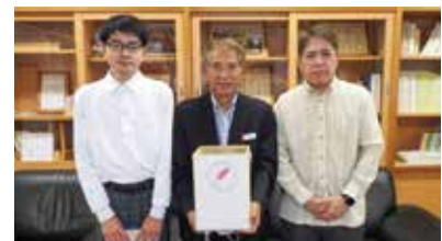
はなさき支援学校