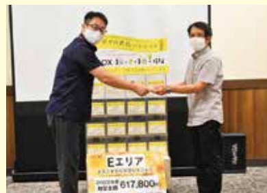
イオン琉球株式会社