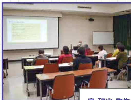
対象者（精神・知的障がい者）の理解