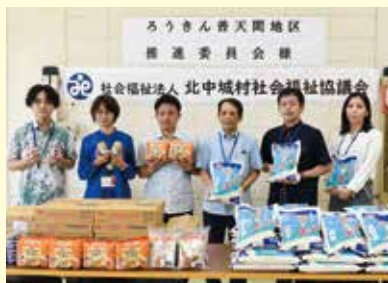
ろうきん普天間地区推進委員会