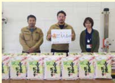
株式会社美橋建設