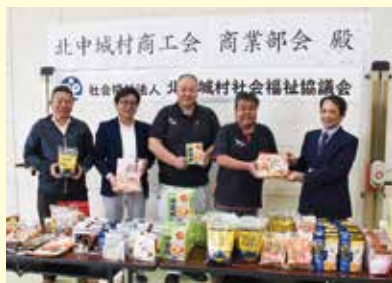
北中城村商工会商業部会