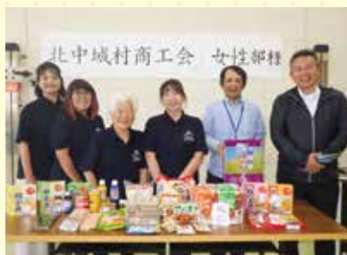
北中城村商工会女性部