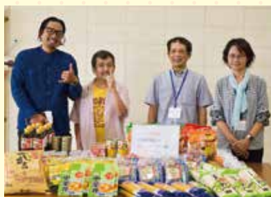
一般社団法人フレンズハウス