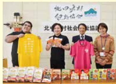
北中城村観光協会