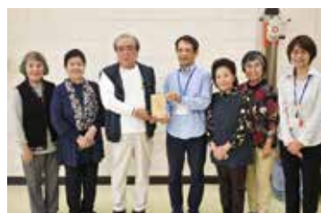
北中城村老人クラブ連合会