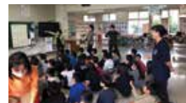
手話サークル若松