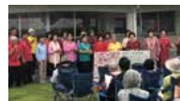
うた声サークル虹