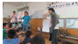
手話サークルかけ橋