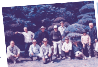
3月 大城老人クラブ

おかげさまで総合社会福祉センター周辺がいつもきれいです。毎月第4金曜日各字老人クラブのみなさんが持ち回りで、総合社会福祉センター周辺の草刈り作業をして頂いております。