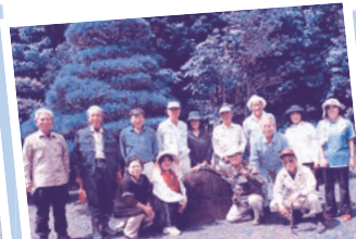
4月 喜舎場熟年クラブ