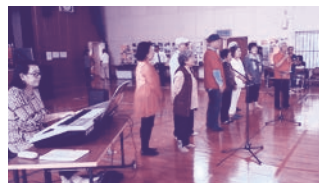
うた声サークル虹