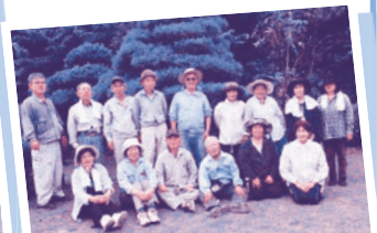
5月 仲順老人クラブ